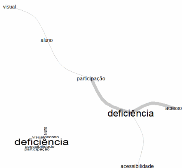
Figura 4. Análise de Similitude da Classe 2.

O resultado da AS (Figura 4) demonstra uma evidência para seis palavras, sendo três evidenciadas no dendrograma das classes (Figura 1) com a inclusão dos termos “visual”, “participação” e “acessibilidade”. A classe apresenta um foco para estudos direcionados a áreas distintas da educação básica e da superior com seis estudos. Além disso, encontram-se na classe três estudos para a educação superior e dois para a educação básica.