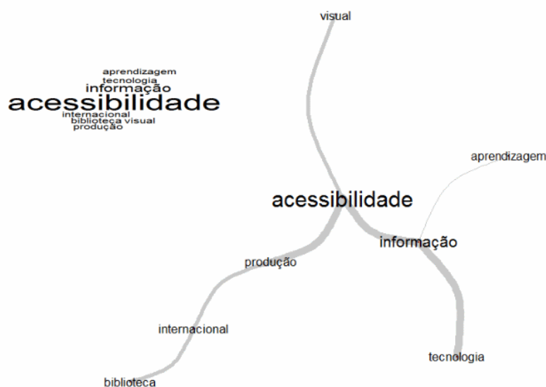
Figura 3. Análise de Similitude da Classe 1.

Observa-se que o resultado da AS (Figura 3) fornece um destaque para oito palavras, sendo as seis destacadas no dendrograma das classes (Figura 1) com a inserção dos termos “visual” e “aprendizagem”. Os resultados apontam três focos dos estudos, principalmente direcionados para a educação superior (seis estudos), em pesquisas com temáticas diversas que não estão relacionadas à educação básica e nem à superior (quatro estudos), e, por fim, estudos relacionados à educação básica (dois estudos).